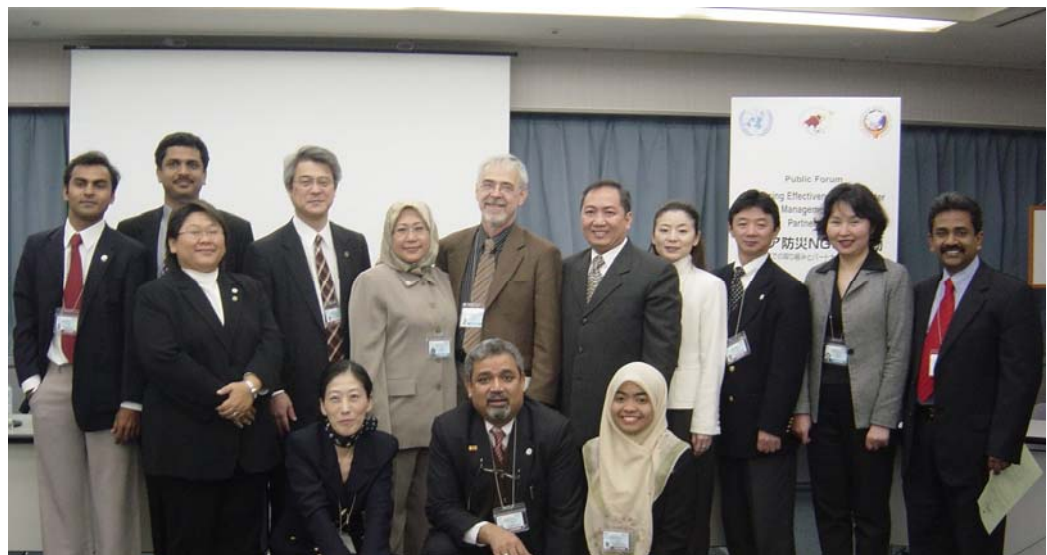
図 4-1-2-3 国連防災世界会議でパブリックフォーラムを主催