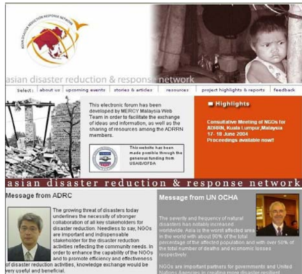
図 4-1-2-2 改訂された ADRRN ウェブサイト http://www.adrrn.net

また、平成 17 年 1 月に開催された国連防災世界会議においては、パブリックフォーラムを主催し、アジア地域での NGO のネットワークによるより効果的な防災・災害救援活動の推進について討議し、またポスターセッションに参加することによって、世界会議の参加者にネットワークの活動についてより広く理解してもらうことができた。